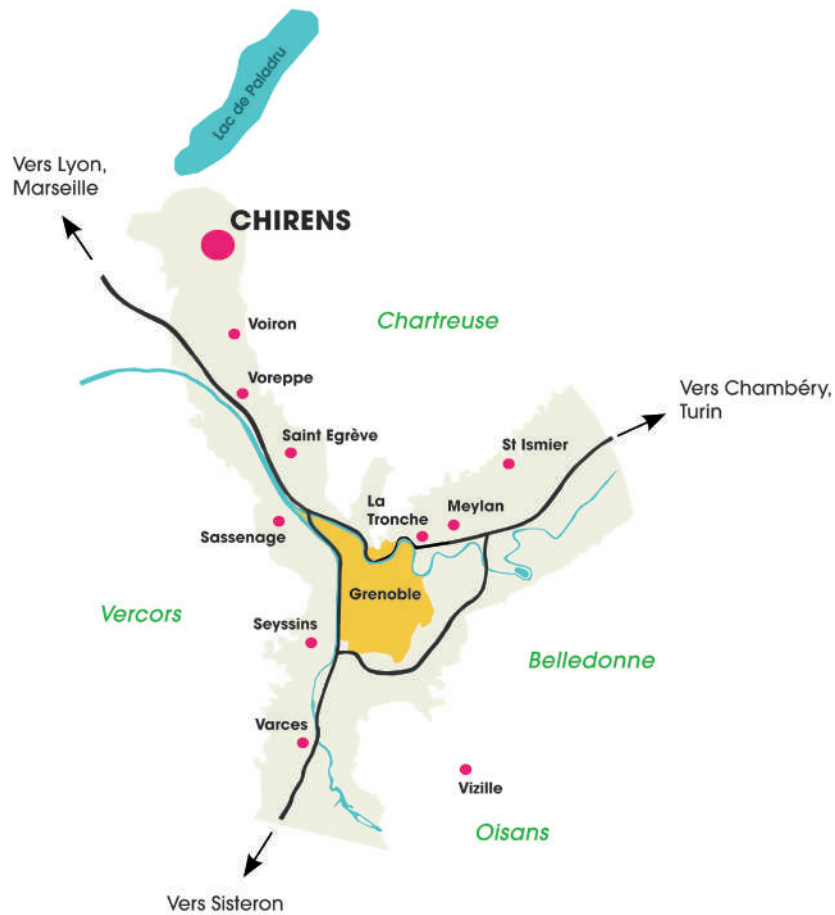
Avenue du 19 mars 1962, Chirens